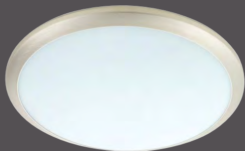
560629 ML Platin