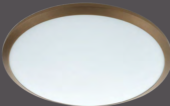
560627 ML Bronze