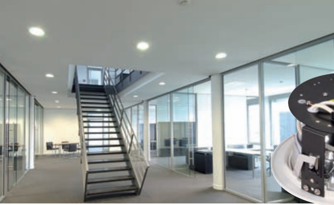
Rückansicht der Essens HQI, weiß (162301)